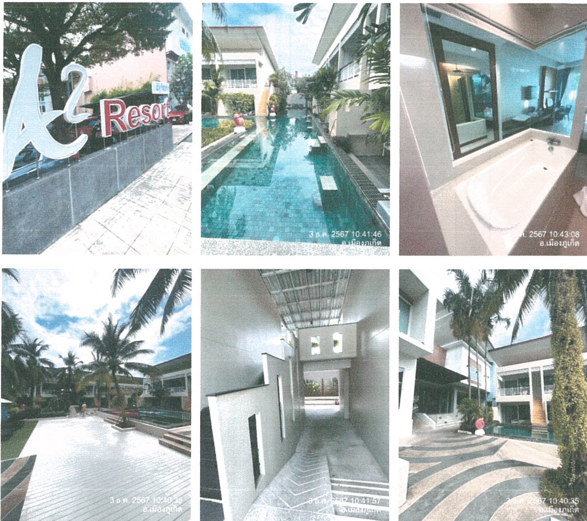
รูปภาพที่ 1.4 การใช้พื้นที่ของโครงการ